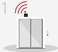
1. Aufzug verbinden