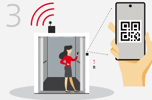
3. QR-Code scannen