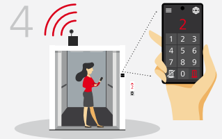
4. Zielstockwerk wählen