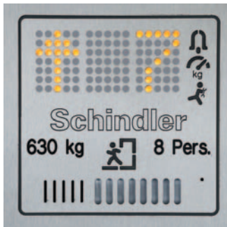
Digitaler Anzeiger im Kabinentableau