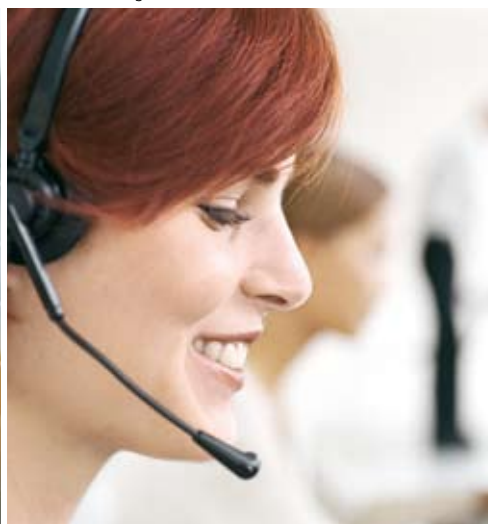
Call Back Management