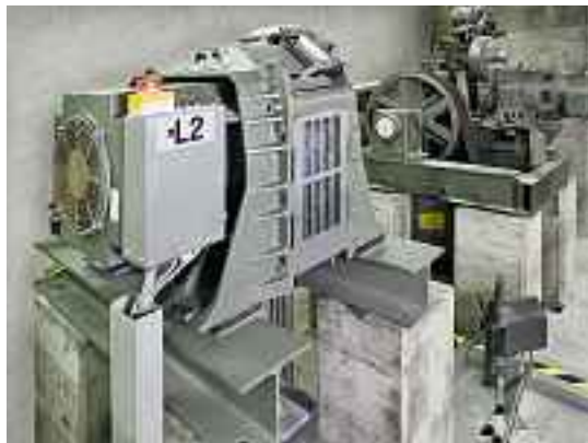
Sicherheit inklusive. Das neueste Dreifach-Bremssystem.

Kompakt, effizient und sicher. Die nächste technische Entwicklungsstufe: Der DR PMS 400 ersetzt einen alten Antrieb (rechts im Bild).