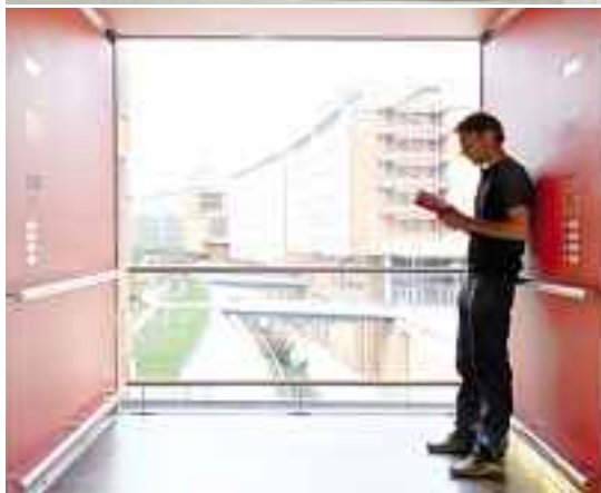
Ruhe und Komfort bei jeder Fahrt.