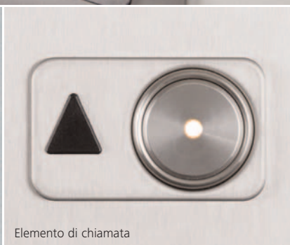
Elemento di chiamata