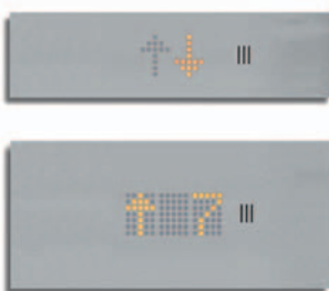
Bottoniera di cabina ►►