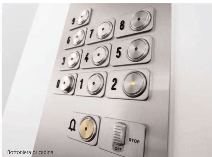
Bottoniera di cabina

La bottoniera FI MXV offre all'utente funzioni logiche ed è semplice da usare. Essa risponde alle norme europee di sicurezza per le installazioni esistenti, è adatta per l'uso da parte di persone diversamente abili ed è dotata di scritte in caratteri Braille. E' anche possibile installare un microfono e un altoparlante per una linea telefonica dedicata 24 ore su 24.