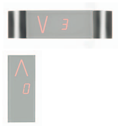
Bottoniere di cabina