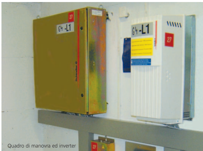
Quadro di manovra ed inverter