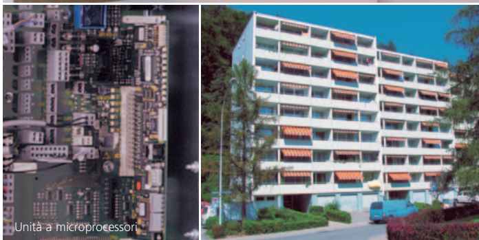
Unità a microprocessori