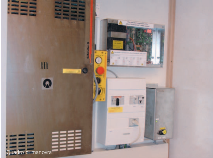
Quadro di manovra

Il cervello del quadro di manovra CO BX è una scheda SIM, nella quale sono immagazzinati in sicurezza tutti i parametri specifici dell'ascensore. L'alto livello raggiunto nella conservazione dei dati assicura al vostro ascensore una lunga vita di servizio salvaguardando così il vostro investimento.