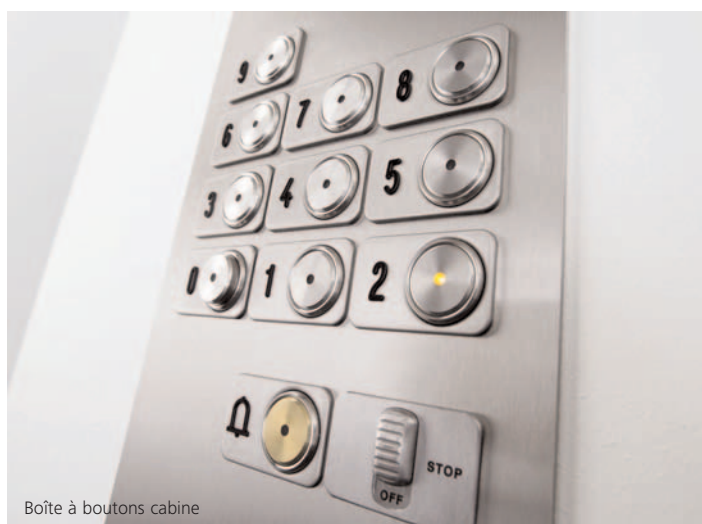
Boîte à boutons cabine

Les boîtes FI MXV offrent aux usagers des fonctionnalités simples et agréables à l'emploi. Elles répondent à toutes les normes existantes, notamment pour les personnes à mobilité réduite et peuvent être en option, gravées en braille. Egalement, des équipements de communication vocale sont disponibles pour une sécurité permanente.