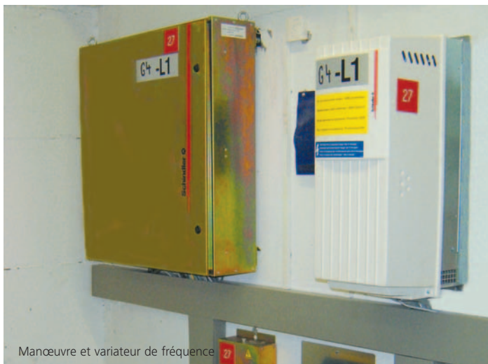
Manœuvre et variateur de fréquence

Le système d'anticipation d'appels Schindler Miconic 10® est disponible en option. Il analyse le trafic pour permettre de réduire le nombre d'arrêts aux étages et éviter les courses à vides. Le fonctionnement est simple, l'utilisateur indique sa destination avant de prendre l'ascenseur qui lui sera affecté. Les temps d'attente et de déplacements sont ainsi réduits pour un meilleur confort.