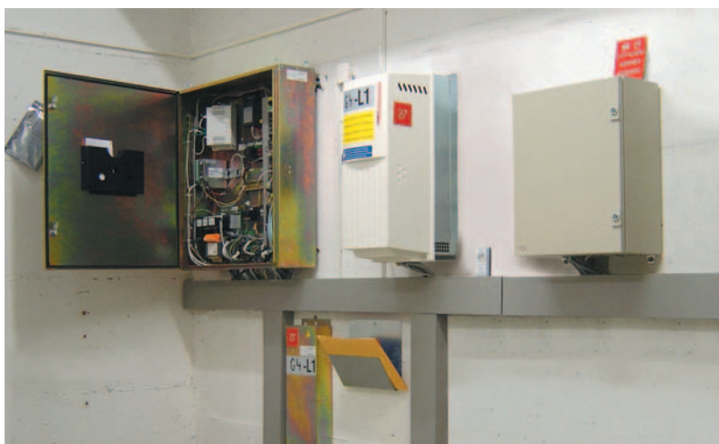
Local des machines

La manœuvre CO MX procure un nouveau transport au quotidien, grâce aux technologies les plus modernes et aux fonctions les plus optimisées.