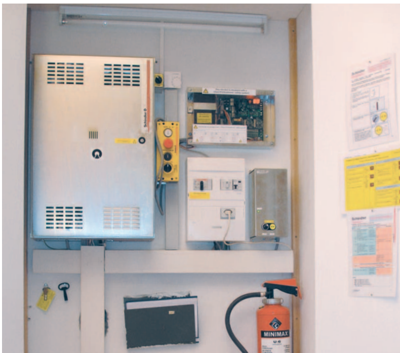
Local des machines

La manœuvre CO BX est un investissement rentable pour l'avenir.